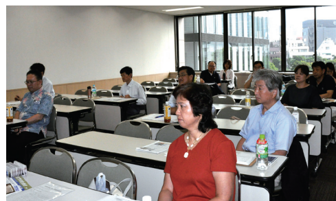
久々に10名以上の参加

業柄手抜かりはないと思いますが、法律に詳しいわけではない殆どの人は“いざその時”身内との別れの悲しみの中、煩雑な手続